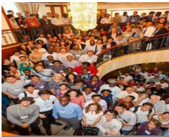
Participation au global forum au Cambodge

Cette forme d'utilisation des combustibles solides pose aussi des problèmes urgents de dégradation des forêts, de pollution de l'environnement et d'accélération des changements climatiques véritable enjeux mondial en ce début de 21 em siècle.