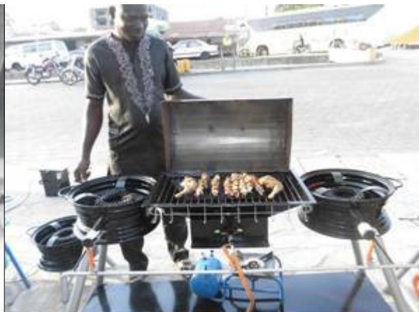
Promotion des foyers économiques photo exposition