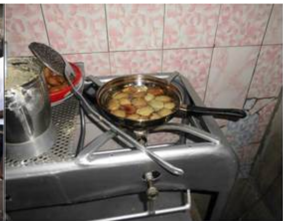
Promotion du biogaz pour le développement durable