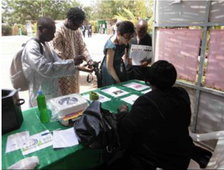
Participation à l'atelier WACCA photo