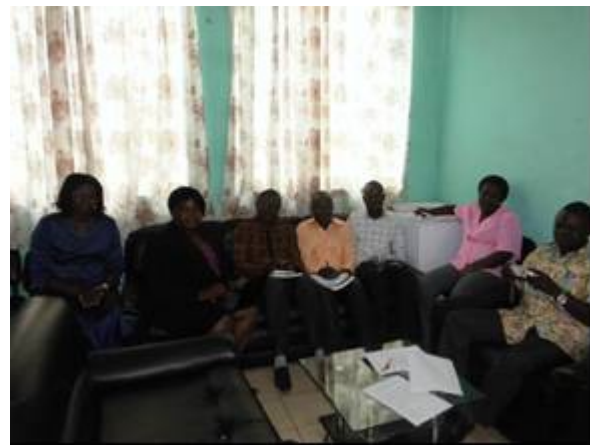
Séance de travail de l'équipe conjointe