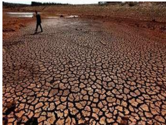
des périodes de sécheresse longues