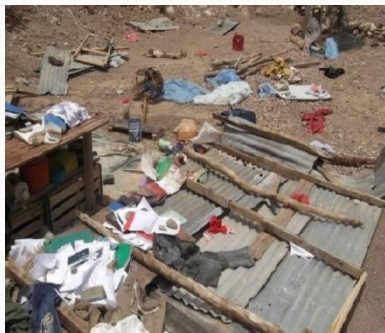
des pluies violentes

apparition des espèces végétales dites envahissantes et nocifs pour l'environnement (prosopis)