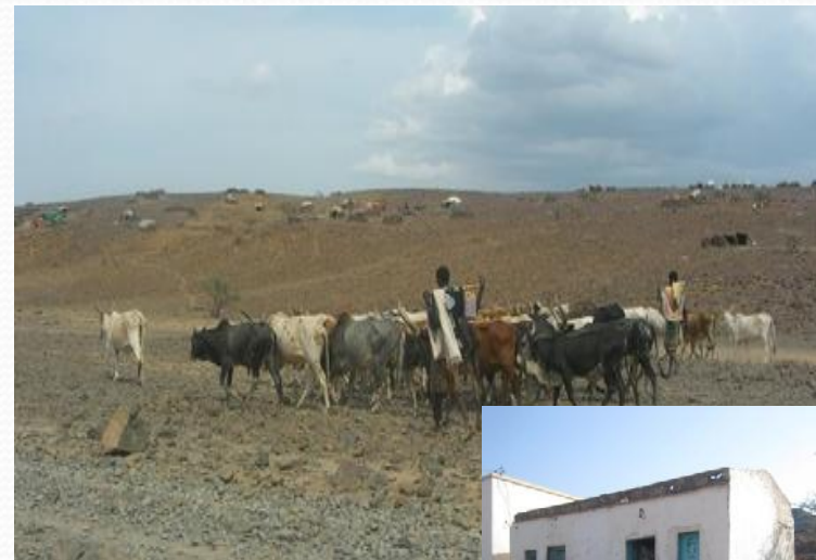
perte des moyens de subsistances