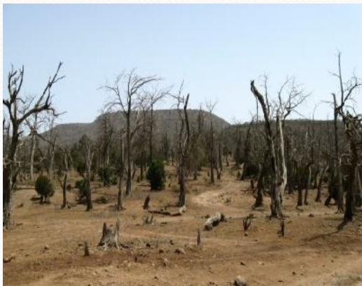
une diminution des ressources naturelles